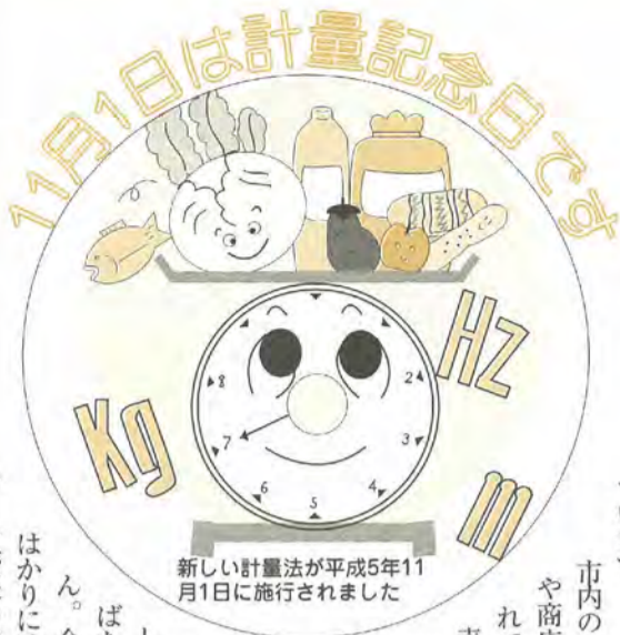
新しい計量法が平成5年11月1日に施行されました

まず、今回は主婦の悩みに焦点を当てて考えます。夫がギャンブルで借金ばかりつくる、アルコール依存性で飲むと暴力を振るう、家に