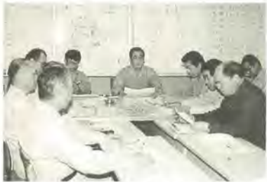
対策本部室会議では、万全の対応を期して打ち合わせを行います。

毎年、秋になると台風が日本に襲来し、各地に多くの被害をもたらします。今年も9月22日に銚子沖を通過した台風17号によって、県内や近隣の都・県に大きな被害が発生しました。