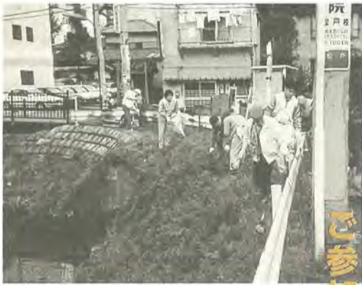
私たちの暮らしに身近な川、きれいにしよう

市民ぐるみでクリーンデーは、私たちの住む街の環境美化とごみ減量の意識を高めるため毎年行われているものです。昨年は三百三十一団体、九万一千人が参加して、三十五トンのごみを集めました。 私たちの街をきれいにするため、皆さんも一緒に街の清掃を試みませんか。 日時：10月27日(日)午前9時～正午(雨天の場合は、11月3日(祝)) 清掃場所：公園や道路などの公共スペース 清掃方法：道路や公共スペースに散乱しているごみを、市が配布するごみ袋(燃やせるごみ用・燃やせないごみ用・資源ごみ用の三種類)に種類別にして集めてください。 ※町会(自治会)によっては日時が異なる場合がありますので、確認してからご参加ください。 ※家庭から出るごみは、出さないでください。 ◎清掃業務課