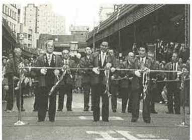
多くの方のご参加をおまちしています

今年で二十三回目を迎える松戸まつりが、10月5日・6日の両日、松戸駅周辺で開催されます。内容等の詳細については、この号でお知らせしておりますので、ご家族そろって参加いただければ幸いです。祭りといえば、今年の夏には「新松戸まつり」や「小金