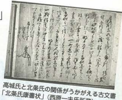
高城氏と北条氏の関係がうかがえる古文書「北条氏康書状」(西原一夫氏所蔵)

申し込み…10月25日(金)までに、往復ハガキに住所・氏名・電話番号を記入し、〒270松戸市千駄堀671松戸市立博物館特別講演会係(☎84-8181番)へ