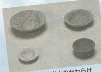
小金城跡出土のかわらけ

9月下旬に、調査員が各事業所を訪問して調査票の記入をお願いいたしますので、皆さんのご理解と協力をお願いいたします。 問 総務部総務課統計係