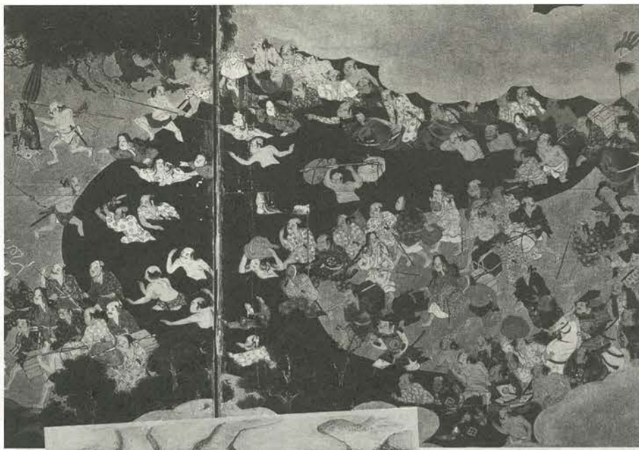
戦場の風景「大坂夏の陣図屏風」(大阪城天守閣所蔵)