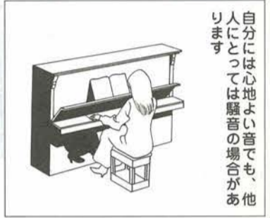
自分には心地よい音でも、他人にとっては騒音の場合があります。