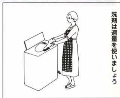
洗剤は適量を使いましょう