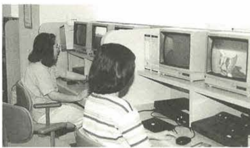
だれでも楽しく簡単に編集できます

10月23日～1月29日の毎週水曜日(12月25日・1月1日・1月15日を除く、全十二回)、午後6時30分～8時30分 会場勤労会館 対象市内在住・在勤の勤労者 定員大極拳五十人、英会話二十人 費用無料 10月1日(火)(必着)までに、往復ハガキに住所・氏名・年齢・電話番号・勤務先・講座名を記入して、〒270-11我孫子市根本三三七の五松戸市役所商工観光課労政係(☎66・7327番)へ