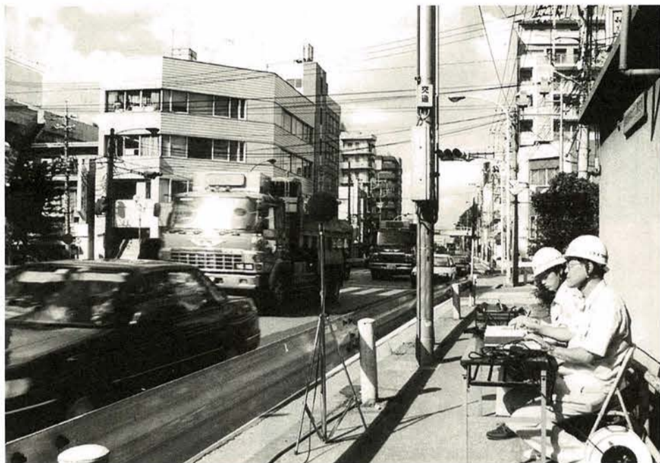
定期的に環境測定を実施しています

市では生活環境を良くするため、さまざまな取り組みをしています。しかし、川や空気の汚染など改善されなければならぬことが数多く残されています。より快適な環境をつくるために、あなたも今すぐにできることから行動に移しましょう。 環境管理課企画調整係