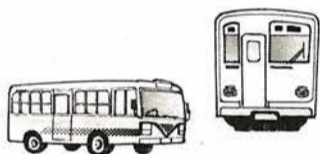
マイカー通勤を控え、電車・バス等の公共交通機関を利用しましょう