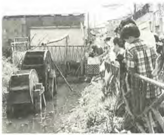
坂川源流の水車に感激!

流山鉄道小金城趾駅から源流まで坂川をさかのぼる約八キロを、空きカンやごみを拾いながら、参加者約二百人が全員無事に歩き通しました。その後、会場を小金原こども遊び場に移し、豚汁を食べてハラペコのおなかを満たしました。