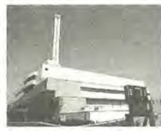
和名ヶ谷クリーンセンター

5月9日(木)午前9時～午後3時30分 コース市役所(集合)～健康増進センター～21世紀の森と広場～和名ヶ谷クリーンセンター(昼食および見学)～消防局～市役所(解散) 定員先着23人 持ち物昼食(飲食店等はありません) 費用無料 岡電話もしくはファクス(62-6162番)で、広報課へ