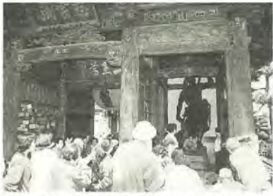
仁王の股くぐりに訪れる人は、後を断ちません

「いつまでもいつまでも、達者でいられるよう力をお貸しください」。願いを込めて仁王様の股をくぐる人たち。馬橋の法王山万満寺(JR馬橋駅東口から徒歩三分で、3月27日、29日に、不動祭りとして知られる恒例の諸厄災いよけの祈禱(きとう)と唐碗(とうわん) 供養の行事が行われました。