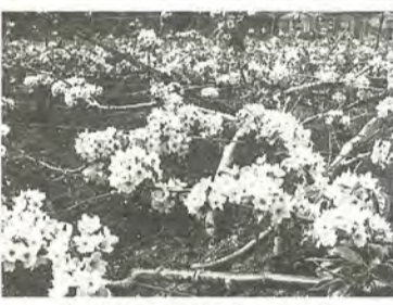
白く可憐な花が咲き乱れます

区の梨園では、梨の花が満開です。梨は棚を作って植えてあるため、辺り一面に咲く花は、フワフワ浮かぶ雲の様にも見えます。また、たくさん実がなるよう、農園の人が筆で花一つひとつを人工授粉させている光景にも出会えるかもしれません。でも、この時期は養蜂業者が梨畑にハチの巣箱を置いて、ハチが蜜を集めているのにご注意を。