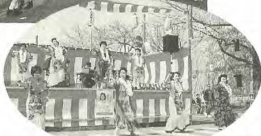
栄冠は誰の頭上に(六実桜まつりのカラオケ大会)

的存在。約三キロ続く桜のトンネルを、多くの観光客が満喫していました。 ○オリジナル企画が魅力 八柱さくら祭り 豊富な催し物と独自性あふれる企画が魅力の八柱さくら祭り。今年も太極拳・エアロビクス・和太鼓に大正琴まで登場し、お祭り気分を盛り上げていました。