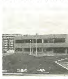
小金原にあるテクノ21

5月12日〜9年4月20日の毎月第2・3日曜日、午前9時〜正午(8月・12月・1月は月1回) 内容 松戸建築組合員による道具の使い方から組み立てまでの技術を個人に合わせて指導 定員 先着20人 費用 3カ月9,000円 園(助)新松戸郷土資料館(新松戸3-27新松戸支所三階) ☎44・1909番