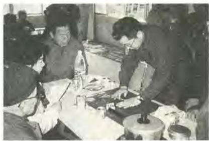
アルミ缶を使つてのコンロ作成

大規模な地震で住む家を失ったり、ライフラインが途切れてしまった場合に、自分の力で衣食住を確保しようと、「震災サバイバル教室」が西口消防署で開催されました。