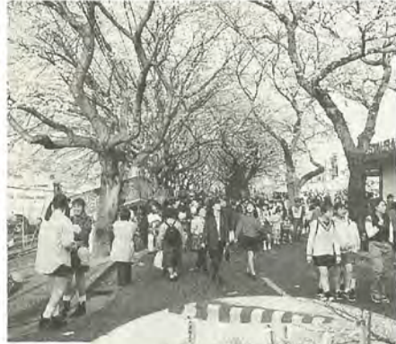
見事な桜のトンネル(ときわ平桜まつり)

六実桜まつり カラオケ大会と約千人が参加の踊りが特徴の六実桜まつり。今年も、参加した人訪れた人を問わず楽しんでいました。また、この季節には珍しい花火も飛び出しました。