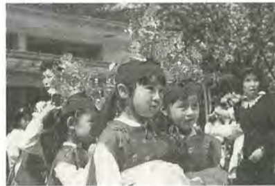
華やかな稚児行列用の衣を着た子供たち

江戸情緒を語り継ぐ、御忌まつりを開催 東漸寺(小金) 水戸街道の四番目の宿場町として長い歴史を持つ小