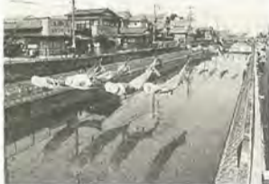
元気に泳ぐコイのぼり

不用になったコイのぼりを4月28日(土)まで募集していますので、ご連絡ください。