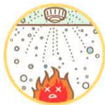
②スプリンクラー設備