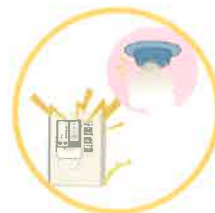
③自動火災報知設備