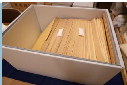
ふたを外して風通しをした後、防虫剤を設置。