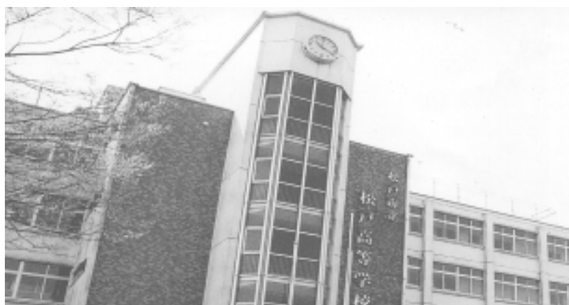
(市立松戸高等学校の概況)

卒業後の進路については、概ね4年制大学、短期大学、専門学校、就職等です。なお、大学等への進学率は約79%(平成16年度卒業生)に達しており、今後さらに進路指導の充実を図ります。