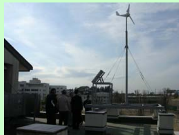
牧野原中学太陽光・風力発電装置