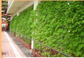
市役所の緑のカーテン

生活や事業活動の中に「生態系配慮」を取り入れて生き物が生息できる場所が確保されたまち