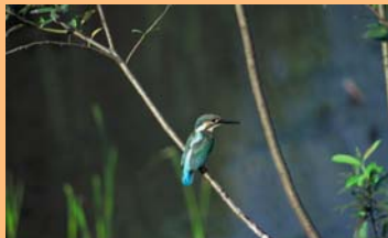
21世紀の森と広場のカワセミ