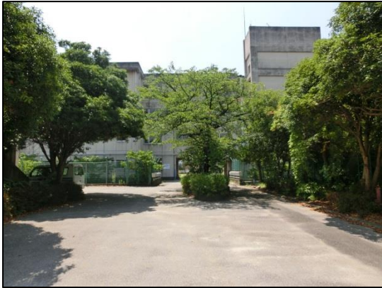
Vista externa 1 de la Escuela Mirai Bunko