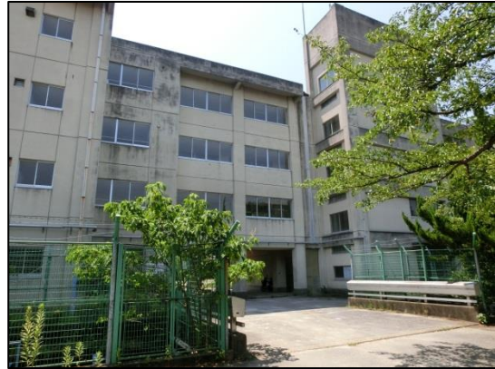
Vista externa 2 de la Escuela Mirai Bunko