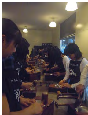
マレーシア研修にて コンピューター作り体験