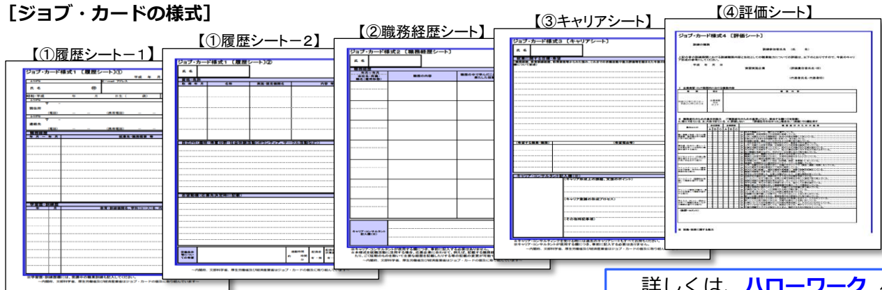
【ジョブ・カードの様式】

ハローワークで求人申込みを行う際には、ぜひ、 応募書類等の欄においては「ジョブ・カードでの応募も可能」と するようにしてください。