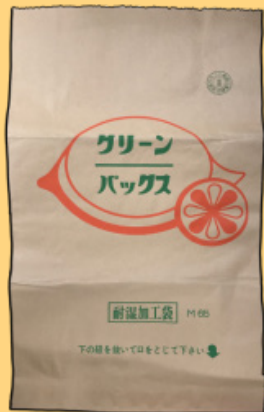
燃やせるごみ用の紙袋