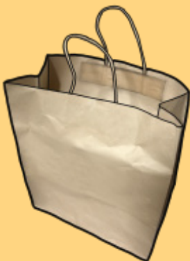
デパートなどの紙袋