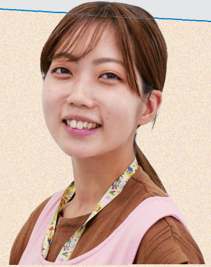
北部幼稚園 年長クラス ともの先生

幼稚園の先生になる道を選ぶ人は、きっと子どものことが好きだと思います。子どもたちが大好きという気持ちがあれば、「子どものために」という視点を持って自分自身も一緒に成長していけるはず。松戸市で一緒に働く仲間が増えたら嬉しいです。ぜひ諦めずに頑張ってください!