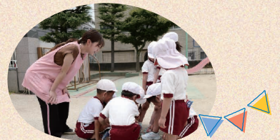
子どもたちの好奇心を見守ります