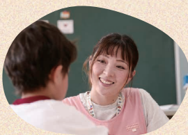
一人ひとりの成長が楽しみです