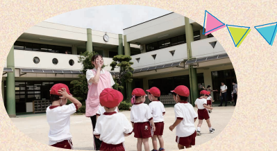
集団生活を学ぶ子どもたちに寄り添います