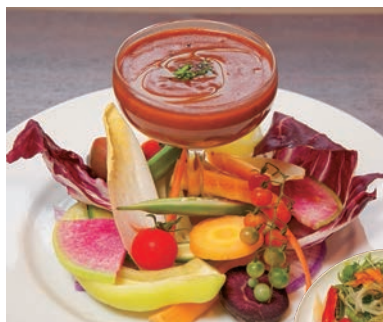
↑自家農園の野菜をお洒落に。 Trattoria il Regalo (→P10)

信頼できる契約農家や自社栽培のオーガニック野菜、添加物不使用の調味料を使う店など、健康を意識したレストランが充実している。手ごろな価格でしかもおいしく健康に食事が楽しめ、身体の中から美しくなる。