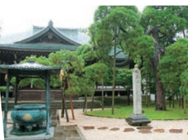
👉530年以上の歴史がある東漸寺 (→P9)