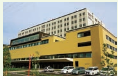
⑥新病院は千葉県北西部の中核を担う病院

2017年12月27日に国保松戸市立病院は、松戸市立総合医療センターとして生まれ変わった。365日24時間体制の救命救急センターや、高度で専門的な小児医療センター、リスクを伴う出産などに対応可能な周産期母子医療センターなどを備える。屋上にはヘリポートを設置し、ドクターヘリによる、重篤な患者の受け入れ体制も整っている。