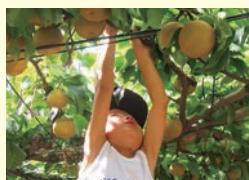
👉豊富な果汁が特徴の梨をぜひ

📍高塚新田532 JR松戸駅から車で25分 🕒入園無料(1kg650円で買い取り) 🕒10~17時(8月中旬~10月上旬) 📄期間中無休(臨時休園あり) 📄25台