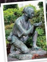
👉一茶も詠んだ 湧水・子和清水

多くの縄文時代の遺跡をはじめ、豊かな歴史をもつ松戸市。千葉県有数の巨大な城郭のあった小金地区や、日本の道100選にも選ばれた桜並木などみどころも多い。自然や歴史を感じつつ、2~3時間程の散歩で身体も心もリフレッシュ!