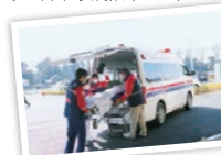
⑤ドクターカーを所有する総合医療センター