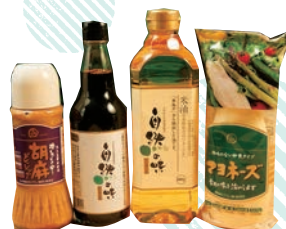
👉まずは調味料から 変えてみよう