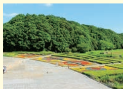
👉園内には四季折々の花が咲く

📍千駄堀269 JR新八柱駅から徒歩15分 🕒入園無料 9~17時(季節により変動あり) 📄無休(一部施設は月曜、祝日の場合は翌日) 📄847台(1日500円)