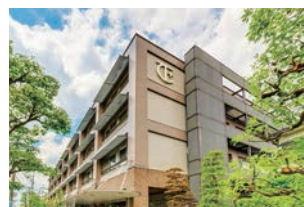
③樋野口にある東葛クリニック病院(→P5)

お年寄りから子どもまで健康に暮らせるように、市全体で取り組み、もしもの時は恵まれた医療機関と、質の高い医療体制で市民の幸福を実現しようとしている松戸市。近年、必要性が叫ばれている在宅医療に関しても、在宅看取りの割合が国や県と比較しても多く、充実した環境が整っている。また心カテーテル治療の技術は全国トップレベルを誇り、県外からの患者も多い。夜間や休日などに対応してくれる施設もあるので、もしものときも安心だ。