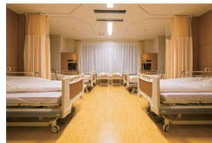
④和名ヶ谷にある新東京病院(→P4)