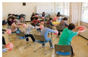
①松戸運動公園(→P12)では定期的に教室を開催