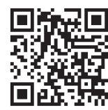
Trường Mirai Bunko