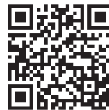
Ủy ban giáo dục

Chi tiết vui lòng truy cập website dưới đây