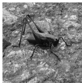
上 ヤブキリ 下 ヒメギス