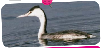
カムリカイツブリ

日本固有の鳥です。ハクセキレイという似た種類もありますが、ハクセキレイは街が好き。セグロセキレイは街が苦手な鳥です。水辺や河原など、水が近くにある場所で生活しています。公園では千駄堀池周辺で見られます。