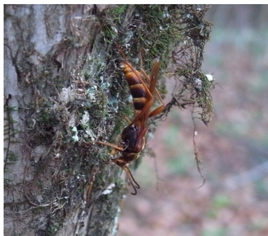
図 4 . トガリバホソコバネカミキリ ハチに本当にそっくりです。 他のカミキリがいなくなる秋に出現します。