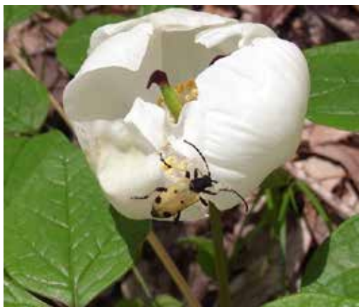
図 1 . フタスジカタビロハナカミキリ ヤマシャクヤクの花を食べる種類です。

なり、ゴキブリにそっくりな種、枯葉に似た種、 どくどく 毒々しい真っ赤な色をした種など多種多様です。熱帯に行くときさらにその多様性には拍車 はくしゃ がかかり、一見カミキリ いっけん リムシにはとても見えないものも多く見つかります。