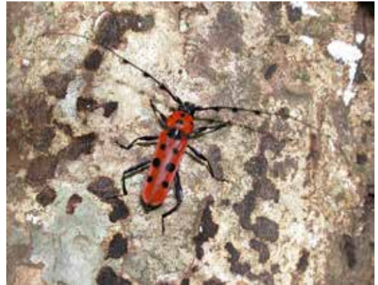
図5. ベニボシカミキリ

るため、後者は成虫の食事や交尾 こうび の場となるため集まってきます。特に新しいまだ茶色い葉がついているような細枝や新鮮な薪 まき 、ミズキやノリウツギ、リョウブなどの花では数多くのカミキリムシが見つかります。一方でそういった多くのカミキリムシが集まるような環境には見向きもしない曲者 くせもの も少なからずいるので、「ここにはカミキリムシはいないだろう」と決めてかからないことが珍しい種類を見つけるコツのように思います。甲虫 こうちゅう の中では大変よく調べられているカミキリムシですがまだまだ都道府県レベルでは初めて見つかる種も多いですし、新種もうまくしたら見つかるかもしれません。