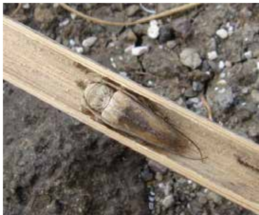
図 2 . ハイイロヤハズカミキリ 竹を食べます。21 世紀の森と広場にも 生息していますが見かける機会はなかな かありません。