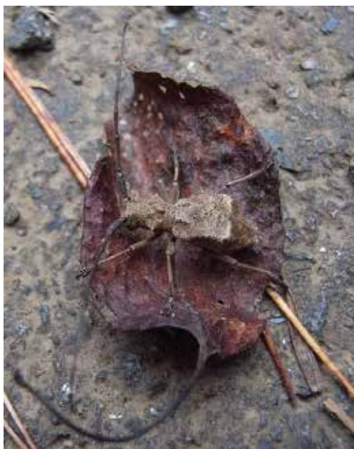
図 3 . セダココバヤハズカミキリ 枯葉を食べ、色は枯葉にそっくりです。