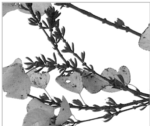
写真：カツラの実がなっている様子

今回は実やタネに注目しましたが、その出発点である花は、一体いつ咲いていたのでしょうか。実は、カツラの花は早春に見られ、この公園の場合、まだ他の木々の芽吹きが始まる前、例年ソメイヨシノの開花の直前くらいに人知れず咲き始めます。オスの木の花もメスの木の花もそれぞれとてもユニーク（花びらがありません！）なので、サクラの話題がにぎやかになる頃に、カツラの花も探してみてください。