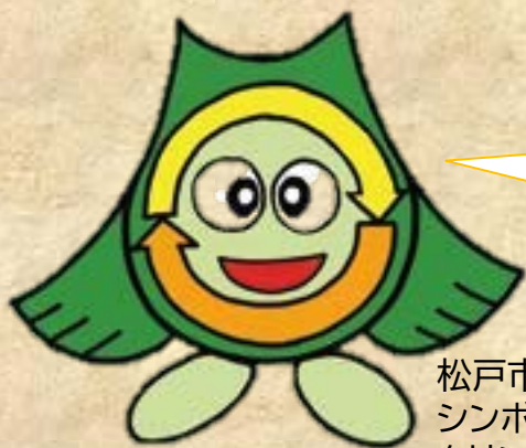
松戸市ごみ減らし シンボルキャラクター・ クリンクルちゃん

※これまでどおり、透明・半透明のポリ袋に「有害ごみ」と明記して出すことも可能です。