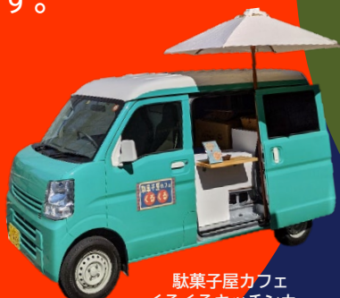
駄菓子屋カフェ くるくるキッチンカー

問:あおば子育て支援センター ☎047-387-5456(平日8時30分~17時)