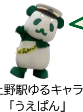
上野駅ゆるキャラ「うえばん」