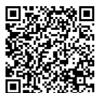
市ホームページ 新型コロナウイルス感染症Q&A

新型コロナウイルス感染症（BA.5系統）の感染者が急増していることを受け、皆さんからの問い合わせが多い内容をまとめました。詳細は市ホームページをご覧ください。