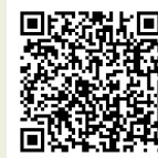
同館ホームページ