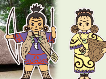
松戸市立博物館公式キャラクター「じょうちゃん・もんちゃん」