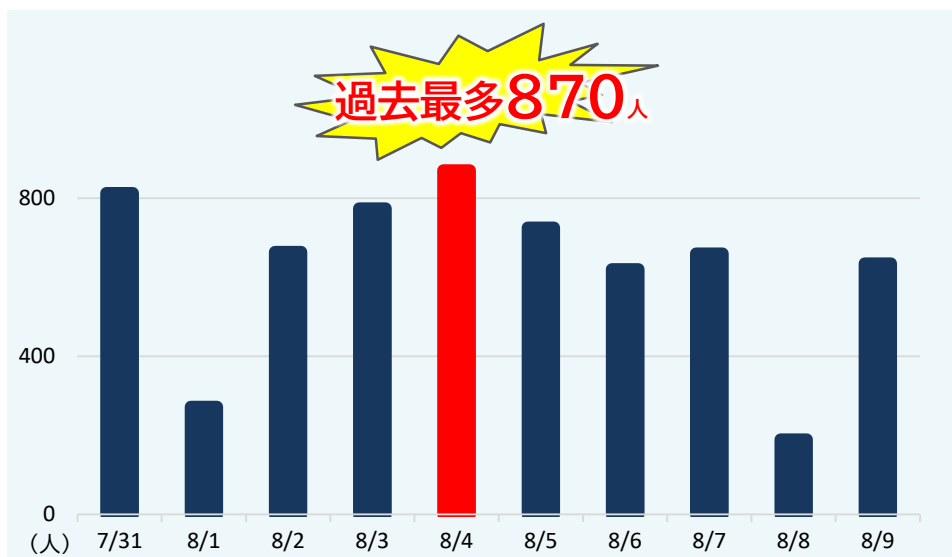
直近10日間の新規感染者数

オミクロン株「BA.5系統」が圧倒的な感染力で急拡大し、第6波のピークを上回っています。 松戸市の新規感染者数は、 8月4日(木)に最多を更新しました。