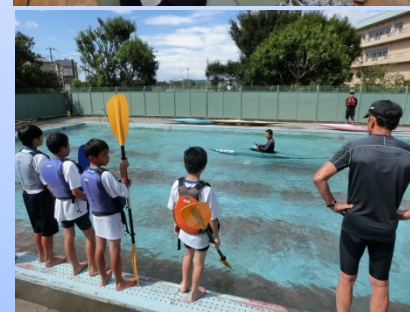
世代交流会の様子