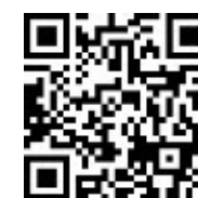
松戸市安全安心メール