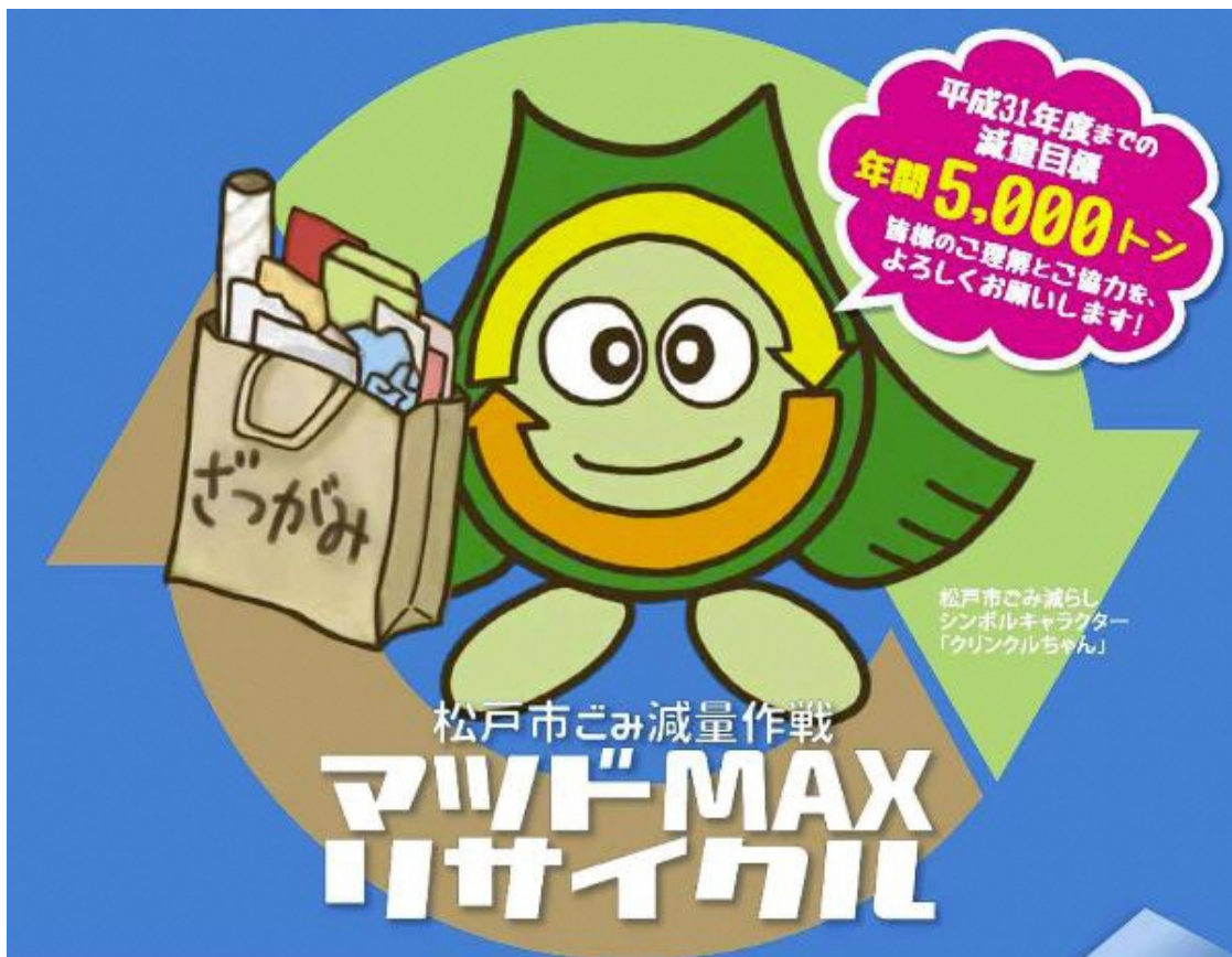
松戸市ごみ減らしシンボルキャラクター「クリンクルちゃん」

近隣市における燃やせるごみの排出方法に合わせるため、平成30年4月1日から紙袋での収集を廃止します。燃やせるごみは「燃やせるごみ専用松戸市認定ポリ袋」で出してください。