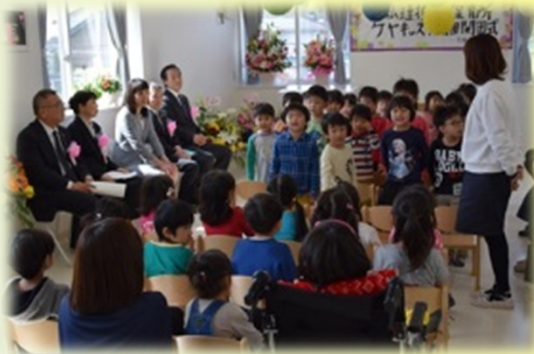
開園式では、保育園「きぼうのたから」のお兄さん・お姉さんからの歌のプレゼントがありました。

待機児童解消を目指し、松戸市が整備を進めてきた小規模保育施設卒園児の受け入れ先確保のため、公と民が協力して実現しました。