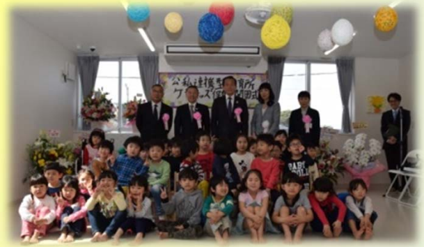
最後は、みんなでパチリ記念撮影。保育園での新しい毎日に、夢がいっぱい膨らんでいるようでした。