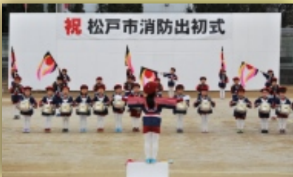
幼年消防クラブのマーチング