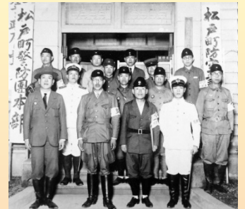
千葉県連合防空訓練 (昭和14年7月松戸町役場)