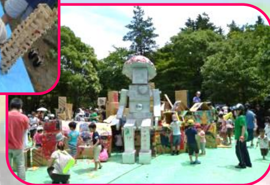
アートパーク7の様子

アートパークは松戸中央公園の全体を活用して、地域と大学が連携したアートプロジェクトです。今まで大勢の子ども達が笑顔で素敵な思い出を作っていました。8回目の今回は千葉大学が初参加します!