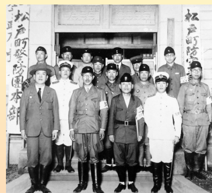
千葉県連合防空訓練 (昭和14年7月松戸町役場)