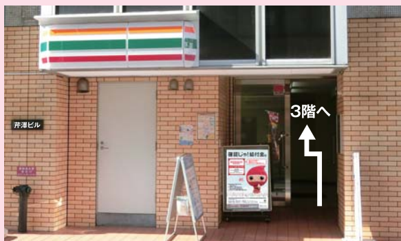
外観(1階がセブンイレブン)