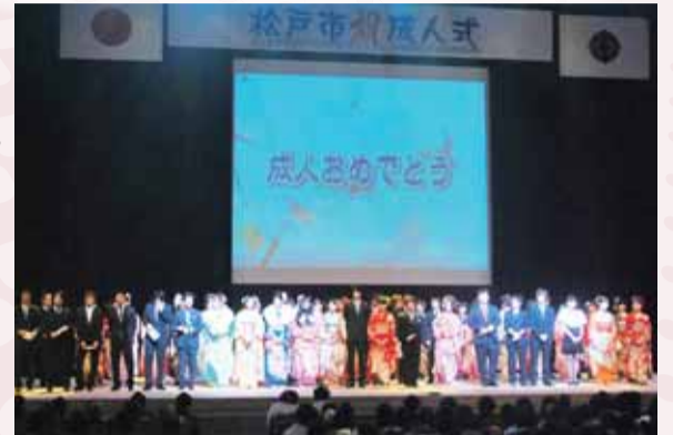
式典の様子(動画)は、2月29日(水)まで、市のホームページからご覧いただけます。

多くの新成人スタッフによる企画・運営の下、1月9日に森のホール21で「成人式～ハタチの“絆”ゆとりドヤァ!!～」が行われました。ステージでは、「新成人ドヤ顔大賞」のコーナーで歌・ピアノ・ダンス等のパフォーマンスが披露され、成人の第一歩に華を添えました。