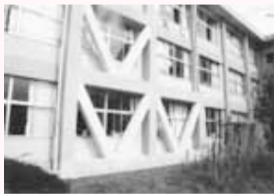
耐震改修後の小金北小学校

見直し後の改修計画では、平成24年度に17棟、平成25年度に28棟、平成26年度に29棟、平成27年度に30棟の耐震化工事を実施する予定です。※詳細は教育委員会のホームページまたは教育施設課へお問い合わせください。圃教育施設課 ☎366-7456