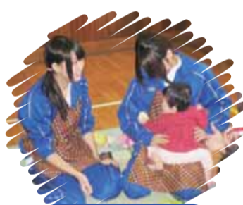
松戸向陽高校の皆さん