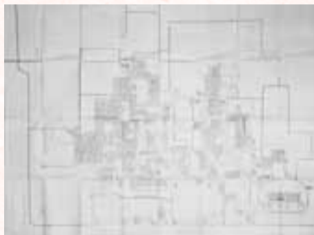
「水戸旧城之図」