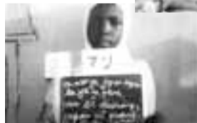
和豪(哲J&ピエール小野)