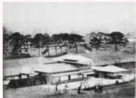
「二条城本丸二」(二条城本丸御殿)