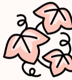
今すぐに行える地球温暖化対策の一例

市では、平成20年度に「松戸市減CO2大作戦(地球温暖化対策地域推進計画)」を策定し、京都議定書の目標達成期間に合わせ、2012年までに1990年度比で6%の温室効果ガス排出量を削減します(短期目標)。なお、2006年度の松戸市全体の温室効果ガス排出量は1,849,000tでした。温室効果ガス排出量の削減に向けて、市でもさまざまな事業を展開していきませんが、各家庭や事業者の取り組みが大きな効果を生みます。今からできることを実施して、「減CO2大作戦」にご協力ください。