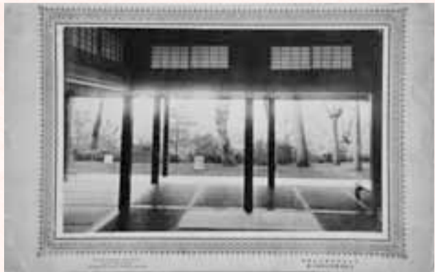
「松莊座敷ヨリ江戸川眺望撮影」(戸定邸表座敷から西方向を望む) 1889年5月4日 江崎礼二撮影 戸定歴史館所蔵