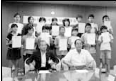
長崎からの帰路、直接報告に来てくれました

9月1日は防災の日です。毎年、総合防災訓練を行っています。今年も、議員総選挙と重なり、実施が困難なため延期することになりました。8月11日早朝、駿河湾沖を震源とする最大