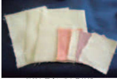
独特な風合いのある竹紙

障害者が竹の繊維から作った竹紙(ちくし)を使った作品を募集します(1人1点まで)。