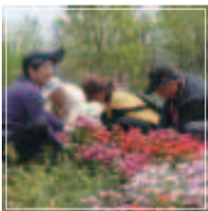
都市公園の整備に活かす「市民力」