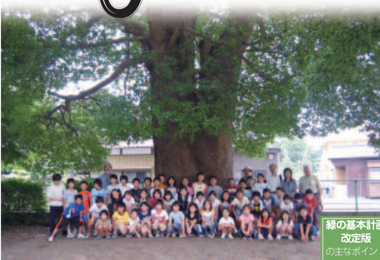
高木小学校の大きなクスノキは、子どもたちのかけがえない友達です

改定版では、「みどりの市民力」による緑のまちづくりを最重要課題と位置付け、計画全編に反映し、推進していきます。