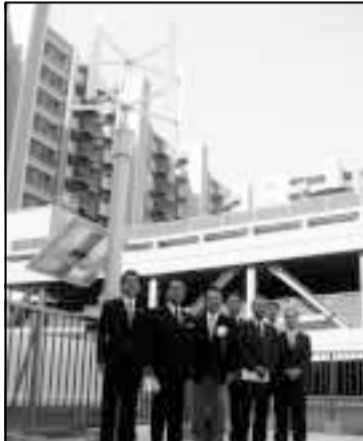
「新松戸未来館」の屋上に設置された「風力・太陽光発電システム」の前で関係者の皆さんと

いよいよゴールデンウィークが始まりましたが、皆さんはどのようにお過ごしでしょうか。遠方にお出かけの方もいらっしゃるでしょうが、市内にもたくさんのお史跡や公園等がありますので、身近な場所を訪ねてみるのもお勧めです。