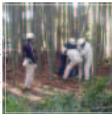
自然環境の保全に貢献するボランティア