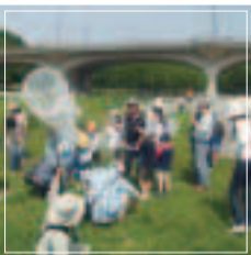
自然観察会等で緑の担い手を育てます