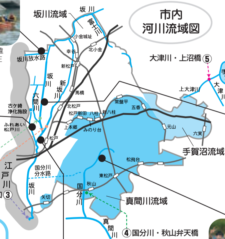
江戸川・栗山浄水場取水口③