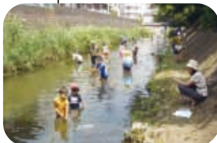
松戸駅から徒歩5分で水辺の自然体験（松戸神社脇の坂川）

BOD (生物化学的酸素要求量) …川などの水の汚れの目安で、数値が高くなるほど、汚れが大きいことを示します。 75%値…例えば、100の調査値があれば、水質の良い順に並べた75番目になる数値で、環境基準の評価を示す数値として使われます。