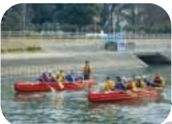
川から見ると景色が違うね（坂川放水路でEボート体験乗船）

坂川・江戸川でのEボート体験乗船会や国分川でのダックレース、川沿いを歩くイベント等を開催しています。最近では、Eボートを使った坂川・江戸川以外の市内河川の体験乗船会を開催しており、身近な川で舟に乗れると子どもたちにも大変好評です。