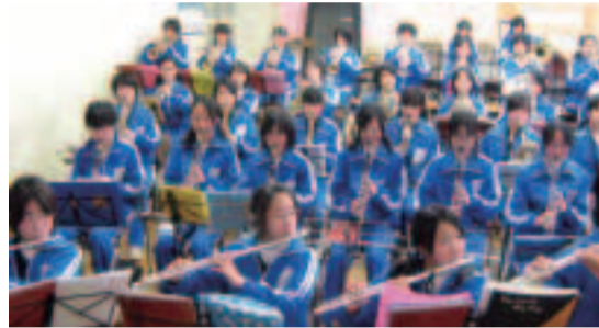
コンサートに向けて頑張っている練習室。聞いてほしいな~♪

3月20日(祝)午後1時~3時 会場新松戸北中学校体育館 内容歌劇「はかなき人生」・デイズニードレ「篤姫」のテーマ他 園同校・佐藤 344・6911