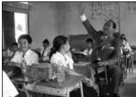
カンボジアのプレイベンクロン小学校の教室で児童たちと

市内の小・中学校で不用になった机やイスを、カンボジア王国に送り、現地の小・中学校で再利用していただいています。そのことに對する感謝式典があり、出席してきました。式では、