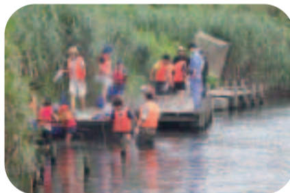
どんな生き物に出会えるだろう？（ふれあい松戸川の生物調査）