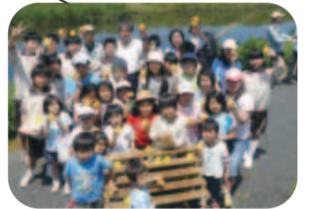
多自然護岸になった国分川でダックレース