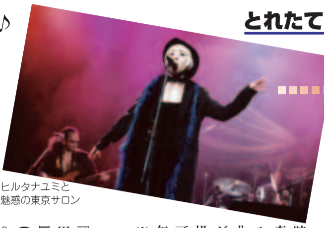
ヒルタナユミと魅惑の東京サロン

今年で十回目となるE・JAM(イージャン)松戸ミュージック・フェスタ。その参加者を募集します。地域に密着した、アコースティック主体のフェスタで、松戸からあなたの音を発信しませんか。