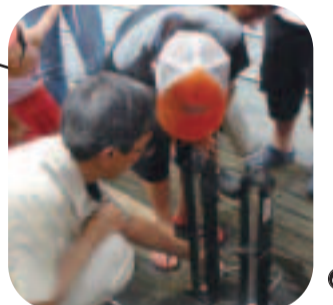
きれいになったかなあ？（坂川で水質測定）

市が主催する他に、市内で活動する河川愛護団体も環境学習を開いています。水質測定器具を用いた測定体験や、クイズ形式の学習などは子どもたちに人気です。