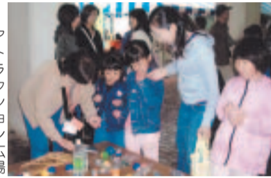
アトラクション広場 二田玉落しゲーム

「みんなこども心で!!」を合言 葉に三世代交流ふれあい広場を開 催します。アトラクション・パフ オーマンズの広場、作品展示の広 場、参加・体験の広場など、六つ の広場を設けます。松戸二中や矢 切高校吹奏楽部の演奏もあるよ! 11月9日(日)午前10時〜午後3時 (雨天決行) 会場総合福祉会館 ◎ 矢切地区社会福祉協議会 ☎368・ 0560