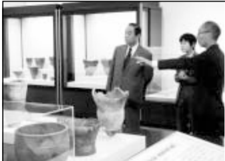
館長・学芸員と「縄文時代の東・西」展を鑑賞

10月1日からしばらくの間、公務で出かける際には電気自動車を利用して来ました。一度の充電で、百五十キロほど走れるそうで、市内を移動するには、十分過ぎるほどです。