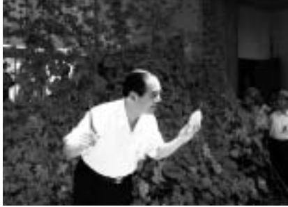
黄色く熟したゴーヤも収穫しました

8月1日号でも触れた、みどりのカーテンとして栽培している市役所のゴーヤが、大きく育ちました。市役所ではプランター栽培ですが、毎日の水やりと追肥がよかつたのか、7月中旬には二階の窓まで達するくら