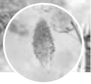
ゴーヤが大きく実りました

市では地球温暖化防止、省エネルギーの視点で、緑のカーテン普及活動を行っています。今年、市内の十数カ所で立派に緑のカーテンが育ちましたので、その一部を紹介します。来年は、皆さんのご家庭でも、ぜひ試してみてください。