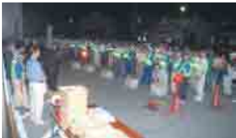
六実支所駐車場で の出発式

参加した人はそれぞれ「防犯パトロール」と書かれたベストとキャップに身を固め、手には赤色灯を持ち、夜の六実・五香地域をパトロールするというもの。今回は、5地区に区分された地図が配布され、徒歩によるパトロールをスタート。午後8時20分から9時30分ごろまで、受け持ち地区を回りました。この地区の犯罪発生率は数年前まで高かったのですが、近年、急激に減少しました。その背景には、住民一体となって継続して防犯活動に取り組んだ成果があるようです。