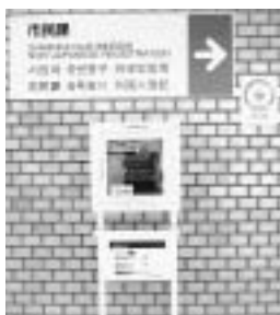
市役所1階に設置したAED

9月4日(月)・5日(火)午前9時～午後5時の間に、電話で消防局消防救急課 ☎ 363-1115へ