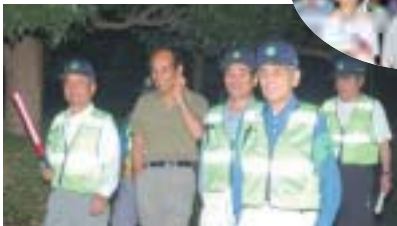
パトロール隊、 夜のまちへスタート!