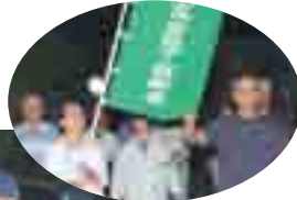
元気いっぱい、六高台2丁目 目町会グループ

参加した人はそれぞれ「防犯パトロール」と書かれたベストとキャップに身を固め、手には赤色灯を持ち、夜の六実・五香地域をパトロールするというもの。今回は、5地区に区分された地図が配布され、徒歩によるパトロールをスタート。午後8時20分から9時30分ごろまで、受け持ち地区を回りました。この地区の犯罪発生率は数年前まで高かったのですが、近年、急激に減少しました。その背景には、住民一体となって継続して防犯活動に取り組んだ成果があるようです。