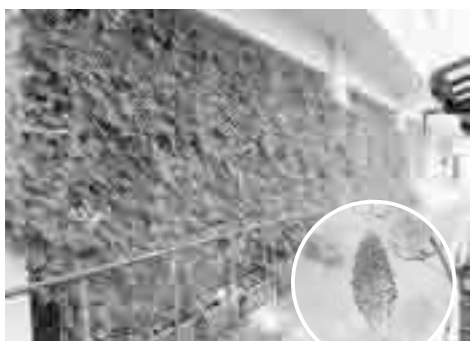
市役所正面玄関わきの緑のカーテン