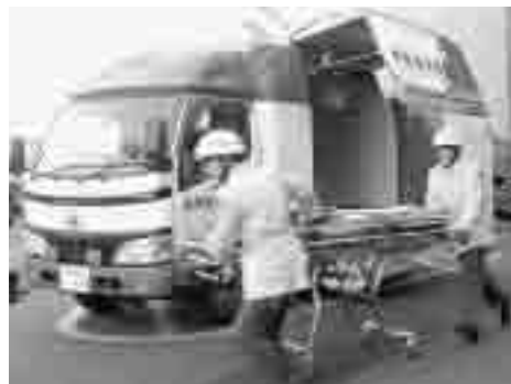
救急車の出動要請は年々増加しています

患者等搬送事業者(民間救急)の認定 市消防局では、9月9日に千葉県タクシー協会に加盟している市内四業者を、患者等搬送事業者(民間救急)として認定する予定です。これは、消防局の定めた基準を満たした事業者が、年々増加傾向にある救急需要に対応するため、緊急性のない患者等を搬送するものです。