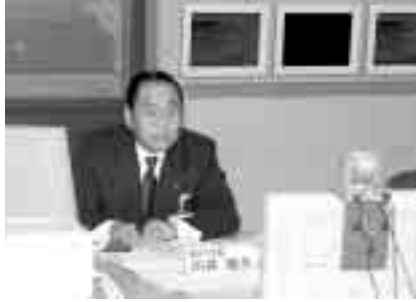
IT防災訓練のテレビ会議に参加

新しい年を迎え、はや一カ月がたちました。昨年、国内外におきましても、大きな災害あるいは、痛ましい事件が枚挙にいとまもなく発生しました。また、今年には阪神淡路大震災から丸十年が経過した