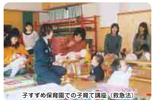
子すずめ保育園での子育て講座(救急法)

子育て中に出会う身近な悩みなどをテーマにした講座です。参加者同士で交流しながら、子育てのヒントを見つけてみませんか。友達づくり、親子のふれあいの場としてお気軽にご参加ください。 ☎直接電話で各支援センターへ