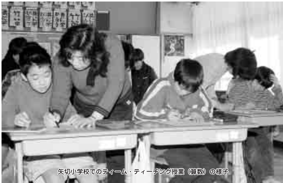
矢切小学校でのチーム・ティーチング授業(算数)の様子

平成16年度から、市立小・中学校へのスタッフ派遣がスタートしました。現在、74人のスタッフが、市内の小・中学校で少人数授業・TT(チーム・ティーチング)・習熟度別授業・小学校教科担任制等を通して、子どもたちに4Rs(読み(Reading)・書き(Writing)・計算(Arithmetic)・責任(Responsibility)という基礎基本)や確かな学力を定着させるべく支援しています。その中から、スタッフ派遣の一例として、矢切小学校での取り組みの様子を紹介します。 図 教育委員会企画管理室 ☎366 7455