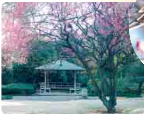
戸定歴史館では、企画展「明治の写真投稿誌『はなのかけ』」を開催中です