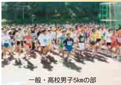
一般・高校男子5kmの部