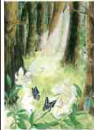
受賞作品「大樹が抱く小さな命」

晴れ渡る冬の日差しの下、毎年恒例の松戸市七草マラソン大会が、1月9日に行われました。