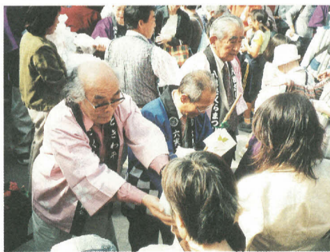
配布は2カ所で行われ、大好評でたちまち終了しました