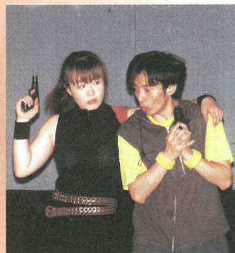
青少年会館芸術祭事業 イマジネーションの芸術 「演劇ワークショップ」