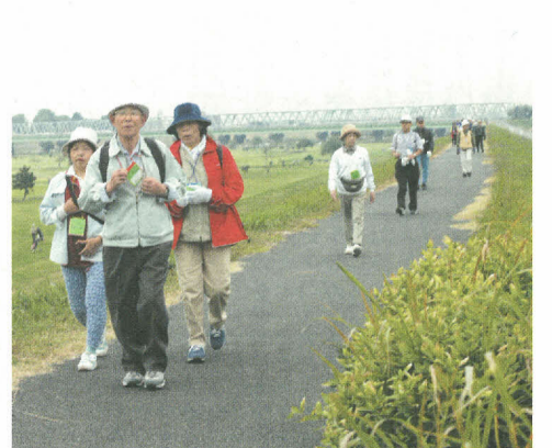
参加者は、江戸川土手をマイペースで歩きました