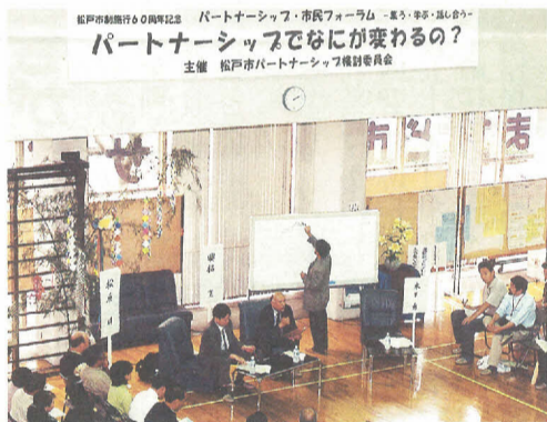
1月にオープンした「まつど市民活動サポートセンター」を会場に