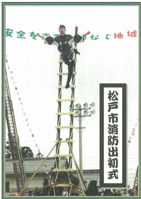
松戸市消防出初式