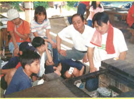
7月5日に行われたキャンプの研修会に参加する子どもたち