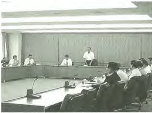
定例の部長会議も開襟シャツで

不順な天候続きの中、時折、地球の環境にやさしい折射す夏の陽も、いよいよ本格的になってきたところですが、今年の夏は電力不足が懸念されています。市としても平成11年度から、地球の環境にやさしい市役所を目指し「松戸市エコオフィス行動プラン」を定めて、日頃より電気や水道、自動車燃料などの使用量削減に、積極的に取り組んでいます。 特に電力の需要が最大となる夏場は、さらに電力削減の取り組みを強化していきます。 ①庁舎の冷房温度を二十八度に設定し、状況に応じて冷房時間を短縮します。 ②昼休みには原則全館消灯し、また、不用品な機器の電源を切ります。