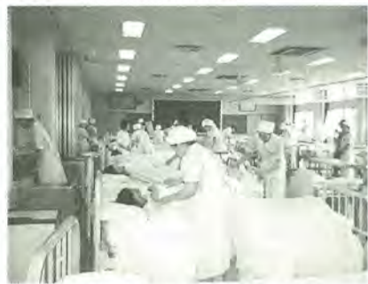
看護学生によるシーツ交換の演習

願書受付期間:平成16年1月5日(月)～9日(金)午前8時30分～正午、午後1時～5時 試験日:1月24日(土)(一次試験) 受験資格:大学受験の資格がある人 募集人数:四十人 ※入学案内を有料で配布しています。 ● 国市立病院附属看護専門学校 ☎ 367・4444