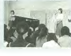
会場健康福祉会館