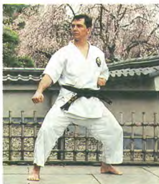
稽古に励むローさん

「タタミゼ」という言葉を ご存じだろうか。畳をもじっ たフランスでの造語で、日本 風の生活様式や室内装飾を取 り入れること。その背景には 日本文化への憧憬がある。