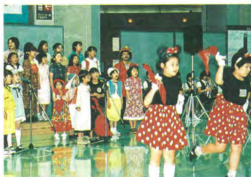
一昨年のちば県人形劇まつり（柏市）

2年に1回千葉県内の市町村で開催される人形劇のお祭りが、松戸市で57団体（個人含む）の上演参加により行われます。