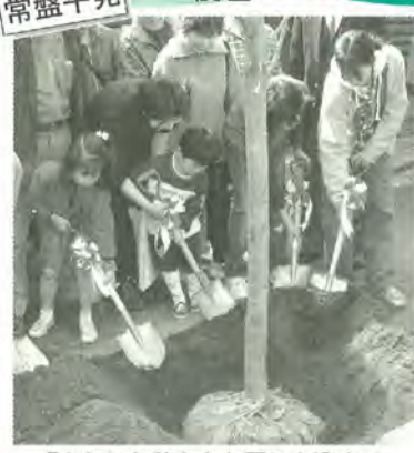
「きれいな花を」と願いを込めて

3月17日、常盤平の「さくら通り」で常盤平団地自治会などによる桜の記念植樹が行われました。 桜の名所として知られる「さくら通り」ですが、植樹後40年を過ぎ、傷んだ木も目立ちます。そこで樹木診断で傷みが激しいと指摘された木を順次植え替えることになり、今回の植樹もその一環。桜に対する理解と愛着を深めてもらおうと小学生も参加し、「きれいな花を咲かせてね」と皆、丁寧に若木の根に土をかけていました。