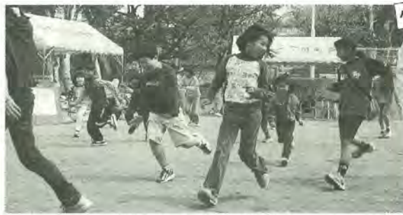
夢中になって走り回りました

3月31日、小金原のつばめ公園で、小金原二丁目町会による小中学校新人生・卒業生の歓迎レクリエーションが行われました。