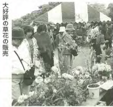
大好評の草花の販売