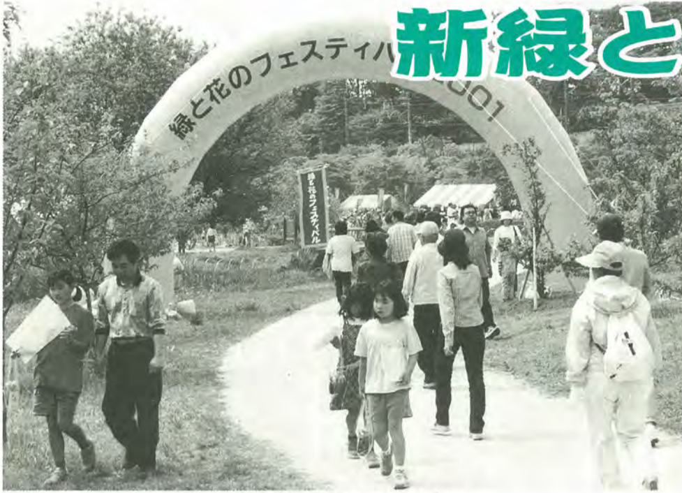
昨年の緑と花のフェスティバル