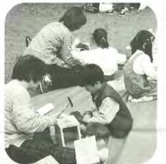
うまくできるかな

体験教室 赤米をつくる 5月5日・12日、7月7日、8月4日、9月8日・15日・29日の各日曜日、午前10時～午後3時(日によって異なります) 会場 21世紀の森と広場内水田 内容 田植えから稲刈り・脱穀・収穫祭まで赤米・黒米づくりに挑戦 対象 小学四年生～中学生 定員 二十人(抽選) 費用 無料 ■ 4月26日(金) [必着] までに、往復ハガキに住所・氏名・電話番号を記入して、〒270-1225 松戸市千駄堀六七一 市立博物館「赤米をつくる」係(☎384-8272)へ