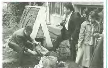
30年前にタイムスリップ?!

3月23日、小金小学校で昭和48年度の卒業生によるタイムカプセルの開封が行われました。昭和48年は小金小学校創立100周年という記念の年。このタイムカプセルは卒業記念をかねて制作した記念碑の中に、「30年後に開封しよう」と約束しあって埋められました。カプセルが掘り出されると集まった卒業生たちからは歓声が。その後行われた懇親会では、皆すっかり小学校時代に戻ったかのようで、いつまでも思い出話が尽きませんでした。