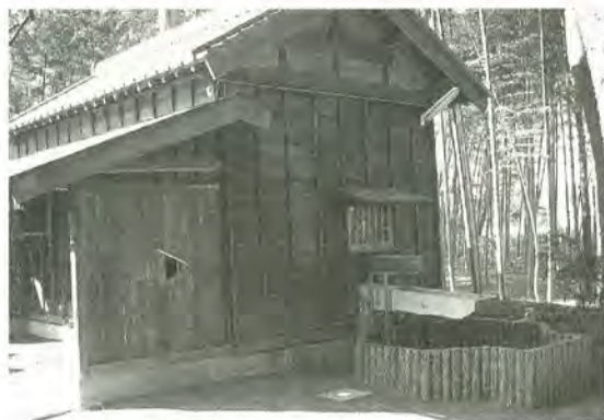
齋藤邸に完成した竹紙工房

竹紙づくりは中国で盛んですが、日本では松戸市にもゆかりのある作家の水上勉氏が、40年ほど前から竹で紙を漉き、竹紙を愛用しています。