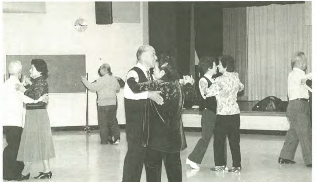
矢切老人福祉センター社交ダンスクラブの皆さん