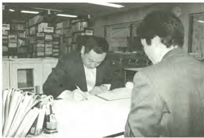
新しい情報公開条例ではどなたでも請求できます

市は、行政運営のさまざまな分野に関する皆さんの情報を提供しています。これらの情報は、市民の皆さんの生活向上や豊かなまちづくりに関する情報です。市では、市民の皆さんの信頼にこたえ、公正で透明な行政運営を進めています。市民の皆さんは、行政運営を進めていく中で、さまざまな分野に関する皆さんの情報を提供しています。これらの情報は、市民の皆さんの生活向上や豊かなまちづくりに関する情報です。市では、市民の皆さんの信頼にこたえ、公正で透明な行政運営を進めています。