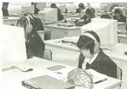
市立松戸高校LL教室での授業風景

市立松戸高等学校では、転入生を受け入れるための試験を行います。 試験日…3月22日(金) 対象…普通科新2・3年生、国際人文科新3年生 募集人数…各若干名 応募資格…保護者の転勤等に伴う転居により、在籍校に通学できない生徒など 募集期間…3月13日(水)～19日(火) ※詳細はお問い合わせください。 園市立松戸高等学校 ☎385-3201