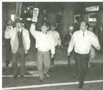
新松戸駅周辺でのパトロール

新しい年がスタートし、早いもので一カ月がたとうとしています。昨年は、世界的にみてもアメリカでの同時多発テロ事件など市民生活を脅かす暗いニュースが多い年でした。松戸市内でも、路上強盗、ひったくり、痴漢などの犯罪が多発し、市民生活を不安に陥れました。