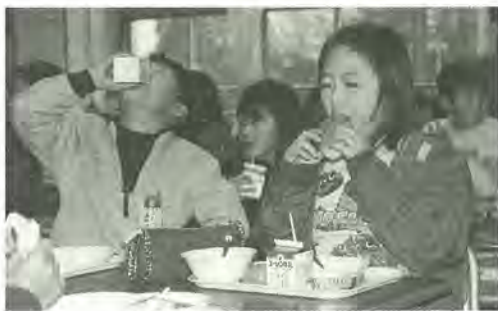
おいしい給食 楽しい給食

もつと和風料理を 平成10年度に松戸市学校栄養士会が実施した「食事に関するアンケート」によると、好きな献立は、カレーライス・混ぜごはん・デザートで、