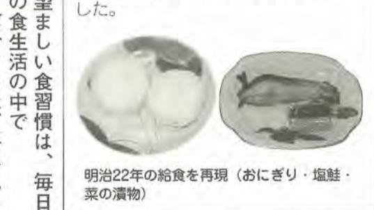
明治22年の給食を再現(おにぎり・塩鮭・菜の漬物)

日本で初めて学校給食が実施されたのは明治22年、山形県鶴岡市の私立忠愛小学校で、貧困児童を対象に行われました。その後、昭和21年12月24日に東京・千葉・神奈川で試験給食が開始されました。この日が戦後の給食開始日となりましたが、冬休みになるため、1カ月後の1月24日を給食記念日とし、この日から1週間が「全国学校給食週間」となりました。