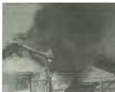
火災は大切な生命と財産を奪います

「たしかめて。火を消してから次のこと」をスローガンに、年末年始火災特別警戒を12月24日(休)から1月7日(月)まで実施します。 年末年始の繁雑期にあたり、これから火災の発生しやすい時期になります。消防局・消防団では出火防止の広報や福祉施設・病院・学校・空き家・新築中の家屋等を巡回するなど、警戒を強化します。 市内での火災の原因は、放火の疑い・放火が上位を占め、今年はこのころによる火災も増えていきます。各家庭での火の取り扱いには、十分注意してください。 また、空気が乾燥し火災の起こりやすい季節です。町会・自治会など地域ぐるみでの放火されない、放火させない環境づくりをお願いします。 消防局警防課 ☎ 363・1115