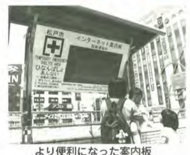
より便利になった案内板

新松戸駅前、八柱駅前に設置したインターネット案内板は、9月から利用できる予定です。 図防防災課 ☎366-7309