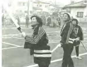
婦人防火クラブの訓練