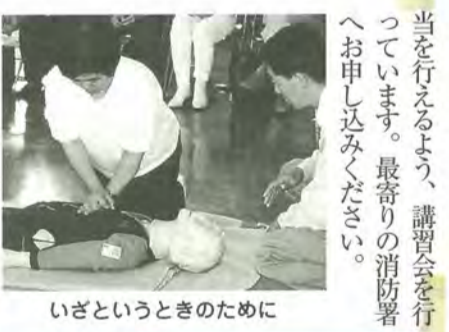
いざというときのために