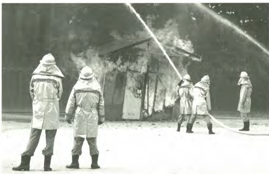
昨年の火災防衛訓練から (第五中学校)

市内八カ所の訓練会場では、実際の避難所生活を送る場合を想定した、いろいろな訓練を体験することができます。災害は、いつ起こるかわかりません。いざという時のために、日ごろからの訓練により、正しい防災知識を身に付けておくことが大切です。 多くの皆さんの参加をお願いします。 防災課 ☎366・7309