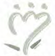
松戸市消費者の会 実物は緑と赤を基調にデザインされています