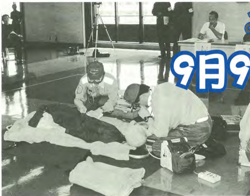
市民の命を守るため、日ごろからさまざまな訓練を行っています (救急競技会での救急訓練)