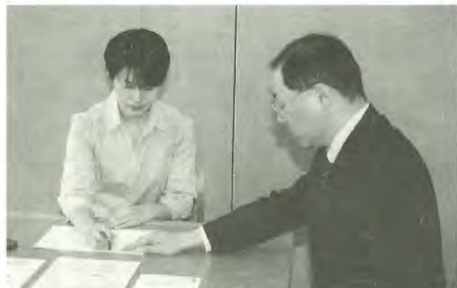
契約するときは慎重に