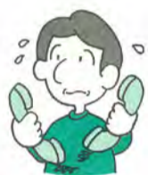
販売時の説明がウソだった

情報、そして交渉力に大きな差があり、とても「対等」とは言えません。これまでは、民法や個別の法律、自主規制だけで対応していましたが、すべてをまかなうことはできませんでした。そこで、消費者と事業者が「対等」ではないことをしっかり認識したうえで、消費者のための新しいルールを設けることが必要となりました。「消費者契約法」が出来ました。 消費者契約法により次のような契約は取り消すことができます。