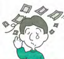
絶対にもうかるって聞いたのに

皮膚のかぶれ等が生じるおそれのある成分が含まれていると知りながら、その説明をわざとしないで、「このクリームを使えばしみ・そばかすがきれいに消えますよ」と説明され化粧品を買わされた。