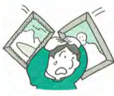
契約しないと帰らせてもらえなかった

子どもの教材を販売に来たセールスマンを自宅に上げたところ、しつこく勧誘するので「用事があるので帰って欲しい」と頼んだが、帰っても戻らず仕方なく契約をした。