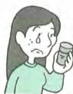
都合の悪いことは教えてくれなかった

その事実はないのに、「今使っているアナログ回線の電話機は、来月から使えなくなるので、デジタル回線の電話機に替えないとダメですよ」と説明され、契約をした。