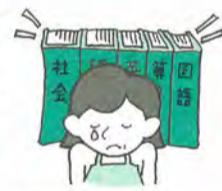
契約しないと帰ってくれなかった

営業マンに電話で勧誘され、「この外国債は絶対にもうかります。円高には当分ならないので確実です」と言われ契約をしたが、すぐに円高になり大損をした。