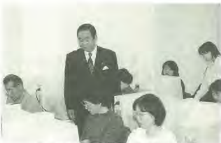
アイ・シティまつどIT講習会で

入学式や桜まつりに春の訪れを感じていたのが、つい昨日のことのようですが、気がつけばもう4月も終わろうとしています。新年度に際して、引き続き、皆さんとのパートナーシップを大切に、開かれ