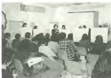
昨年の「ゆうまつどフェスタ」での分科会報告

昨年「ゆうまつどフェスタ」での分科会報告。対象市内在住・在勤・在学の女性 定員先着三十人 ※保育あり(要予約。二歳以上就学前、先着八人)。 5月10日(木)までに、電話で女性センターゆうまつど ☎364・8778へ