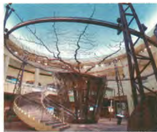
二十世紀梨の巨木(枝の広がり420cm)は施設のシンボルです