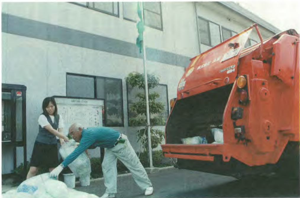
事業所のゴミは市の許可を受けている業者に委託するなどして、適正な処理をお願いします