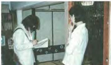
常設展示室(復元された常盤平団地)内でのインタビュー