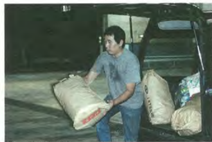
和名ヶ谷クリーンセンターでの自己搬入

▼燃やせるごみ（生ごみ、剪定枝等）：和名ヶ谷クリーンセンター ☎ 392・1118 ▼燃やせないごみ（プラスチック、ビニール等）：日暮クリーンセンター ☎ 388・6555 ▼資源ごみ（紙類、布類、ビン・カン類等）：資源リサイクルセンター ☎ 384・7890