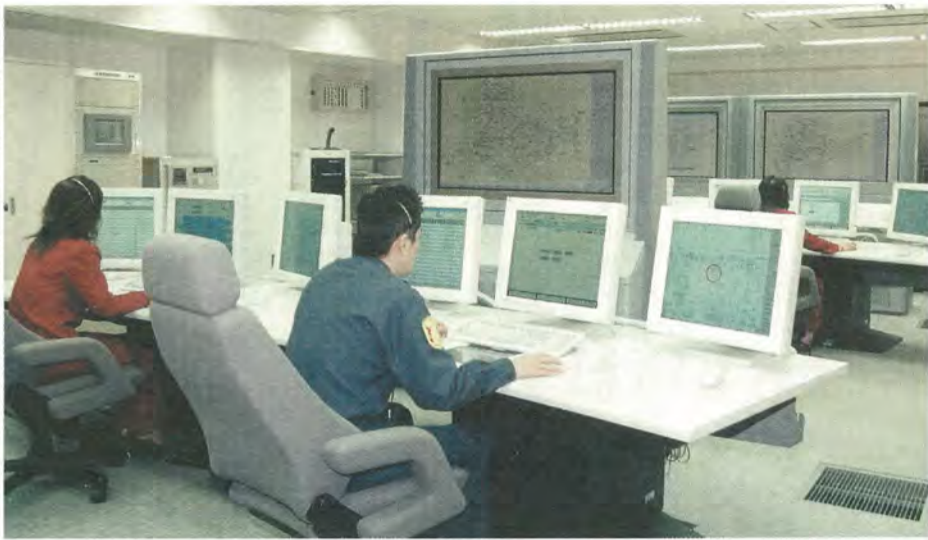
消防局の指令台。ここで災害情報を一元管理しています

今までは、通報を受けてからの到着時間を、火災出場後八分以内、救急出場では五分以内としていましたが、このシステムの導入は、さらに一分縮めて対処することを目標としています。「災害死亡者ゼロ」をめざしてより迅速・的確な対応で市民の生命と財産を守ります。