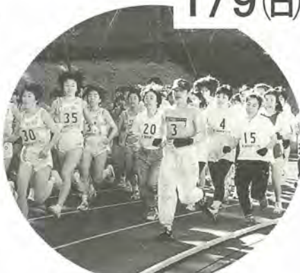
今年の七草マラソン大会

日時：1月9日(日)午前8時～8時30分受け付け、8時40分開会式 会場：運動公園陸上競技場 申し込み方法：12月17日(金)までに、所定の用紙に種目(下表のとおり)・住所・氏名・生年月日・勤務先または学校名を記入して、費用を添えてスポーツ課(運動公園内)または小金原・常盤平・柿ノ木台公園体育館の各窓口へ