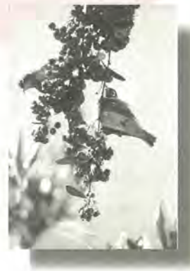
平成10年銀賞作品「夫婦来訪」