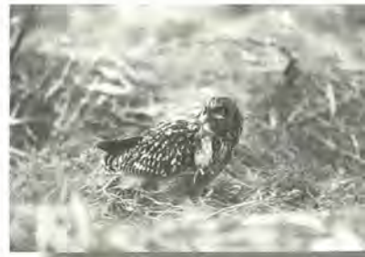
平成10年金賞作品 「コミミスク ねずみをゲット」

内容野鳥を題材にしたカラー・白黒のキャビネ以上、四つ切りまでの写真(未発表作品に限る。巢の近くの写真は不可)手賀沼のコブハクチョウ等の人為的に飼育されているものを除きます。 ※県内および近隣都県での撮影とします。 ※入賞作品は返却しません。 〇2月10日(日)必着までに、応募用紙(各支所・〇まつど街と水辺の緑化基金で配布)を作品の裏に張った上、直接または郵送で、〒270-2252松戸市千駄堀749 〇まつど街と水辺の緑化基金 ☎345-9846へ