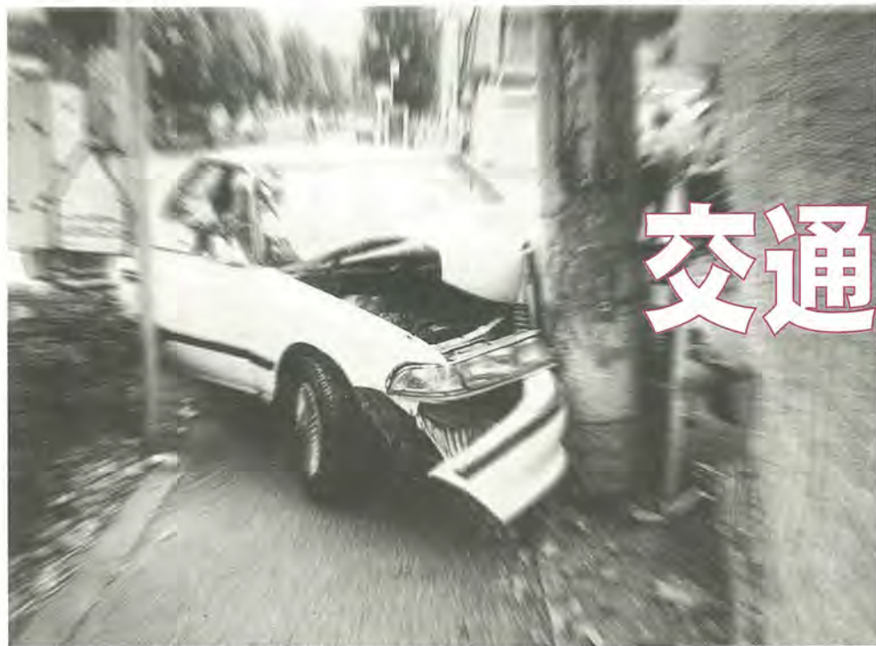
交通事故は、一瞬で自分だけでなく多くの人を不幸にします